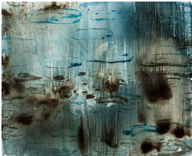
KRAJINA S MRAKY / 2018-19 akryl/plátno, 100 x 120 cm