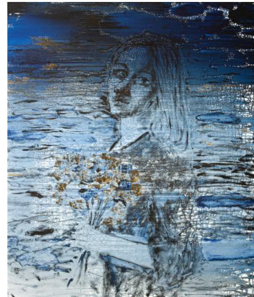
PORTRÉT V / 2022 akryl/plátno, 120 x 100 cm