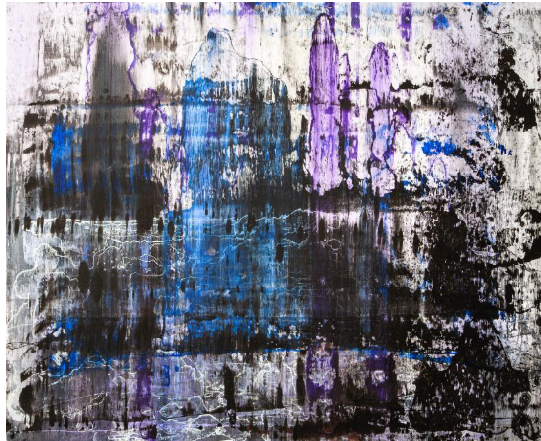
MODRÉ HORY / 2016-17 akryl/plátno, 100 x 125 cm