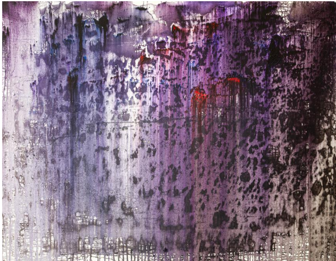
KRAJINA V DEŠTI / 2016-17 akryl/plátno, 100 x 125 cm