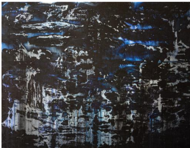
IMAGINATIVNÍ KRAJINA / 2018-19 akryl/plátno, 100 x 120 cm