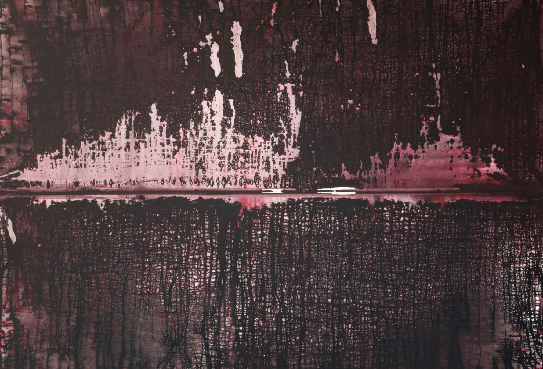
KRAJINA S HORIZONTEM / 2016-17 akryl/plátno, 155 x 190 cm