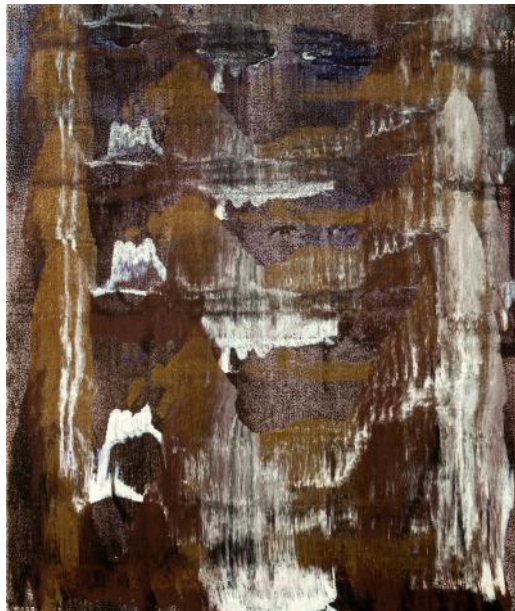
OČI MEZI HORAMI / 2018 akryl/plátno, 100 x 80 cm