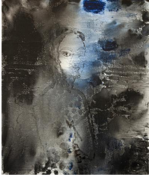
PORTRÉT I / 2022 akryl/plátno, 120 x 100 cm