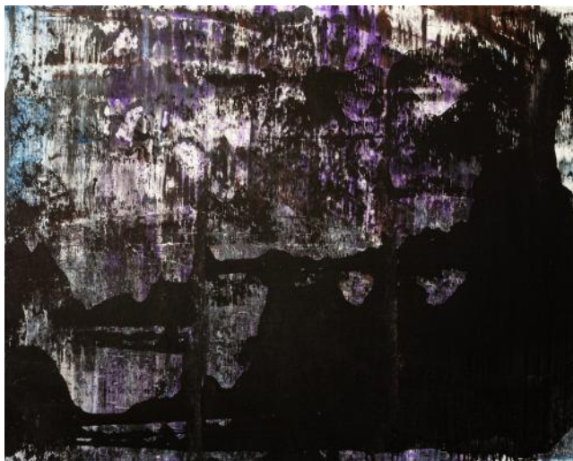
ČERNÉ POHOŘÍ / 2016-17 akryl/plátno, 100 x 125 cm