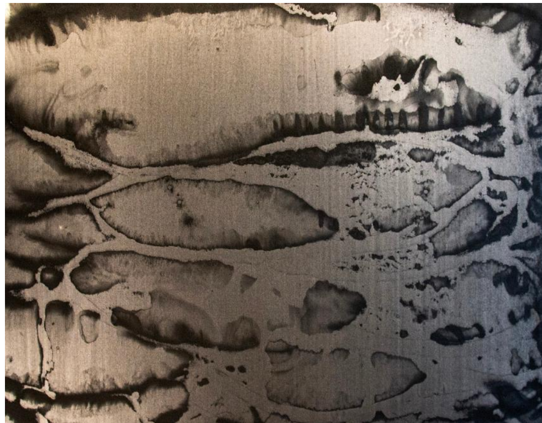
ČERNÁ ZAHRADA / 2018-19 akryl/plátno, 100 x 125 cm