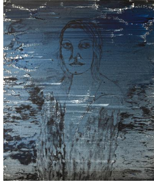
PORTRÉT IV / 2022 akryl/plátno, 120 x 100 cm