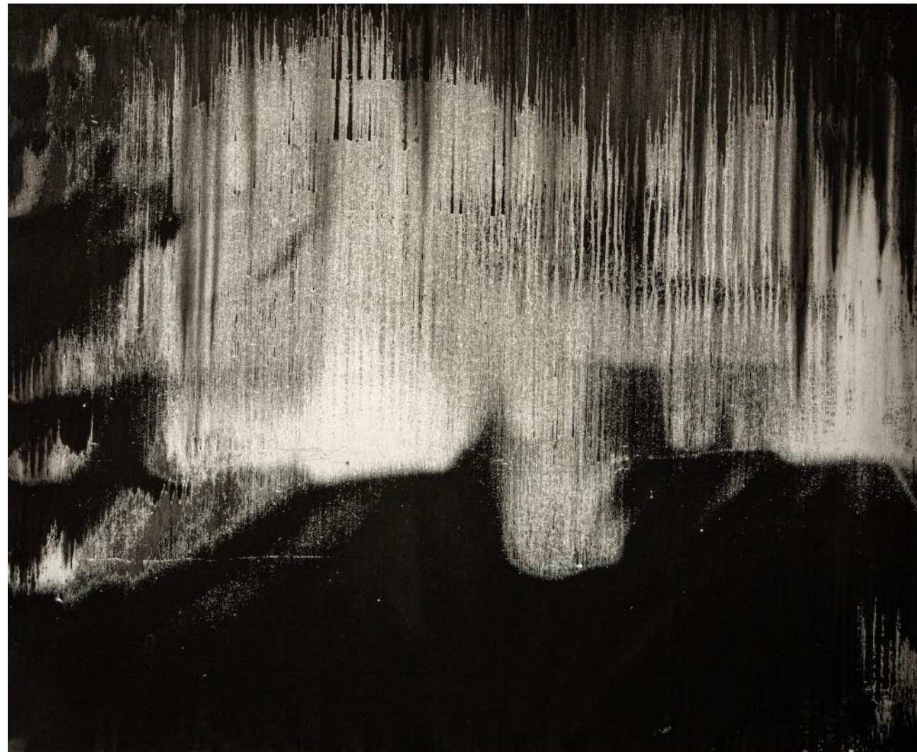
METROPOLIS / 2018-19 akryl/plátno, 100 x 120 cm