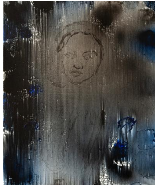
TVÁŘ II / 2022 akryl/plátno, 100 x 80 cm