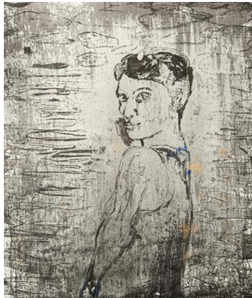
TVÁŘ I / 2022 akryl/plátno, 100 x 80 cm