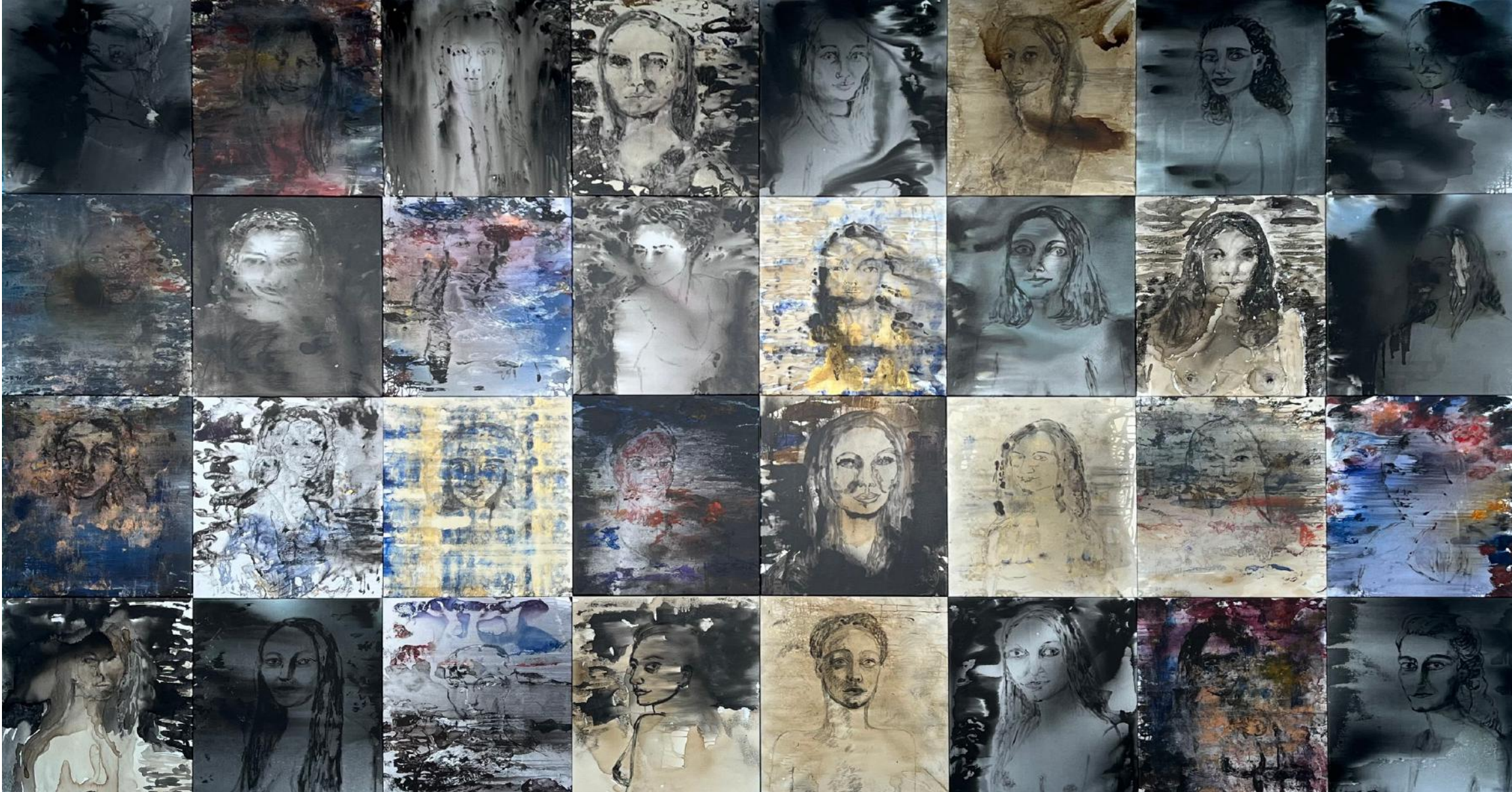
ŽENSKÉ TVÁŘE / 2022 akryl/plátno, 80 x 65 cm (32ks)