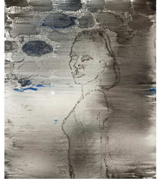
PORTRÉT III / 2022 akryl/plátno, 120 x 100 cm