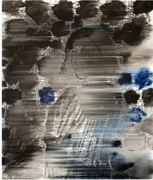
PORTRÉT II / 2022 akryl/plátno, 120 x 100 cm