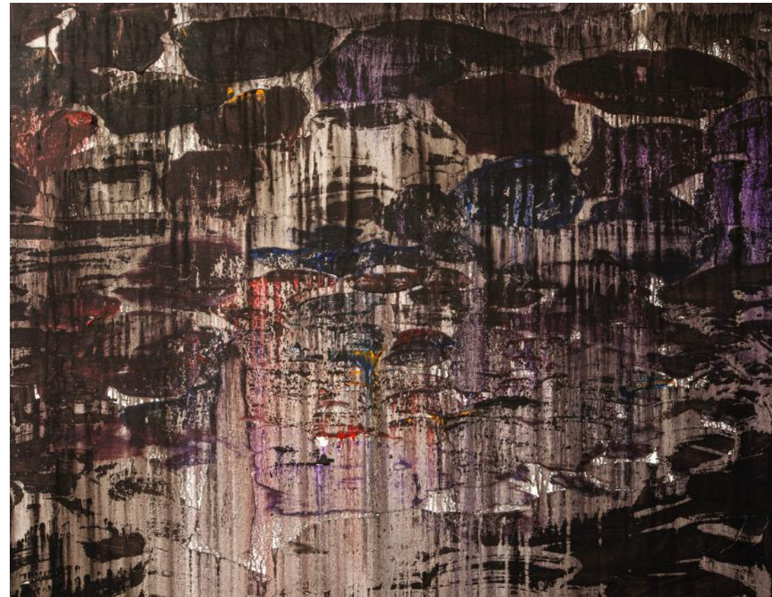
ROZPUŠTĚNÁ KRAJINA / 2016-17 akryl/plátno, 100 x 125 cm