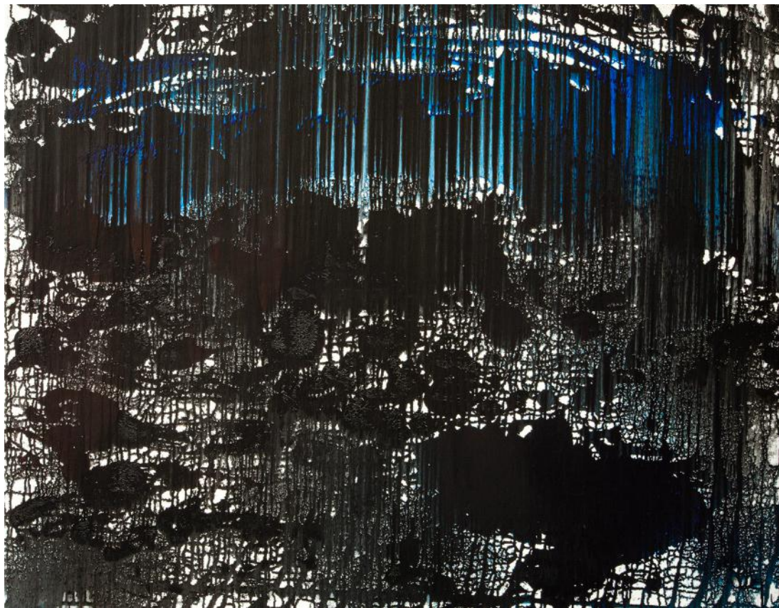
KRAJINA V NOCI / 2018 akryl/plátno, 100 x 120 cm